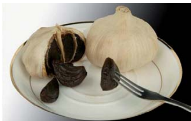
⋮ Gefermenteerde knoflook heeft een weerstandsverhogende werking.

De weerstandsverhogende werking van de zwavelcomponenten van knoflook tegen schimmels zoals candida, tegen virussen zo-